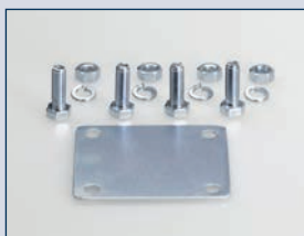
Artikel-Nr. 70-5211.04 Verstärkungsplatte