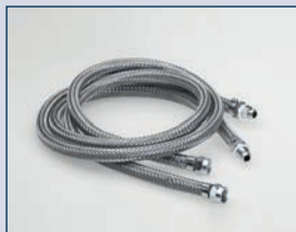
Artikel-Nr. 2561.13 Verbindungsschlauch Ø 13 mm, 1 m lang mit 1 Überwurfmutter, 1 Überwurfschraube sowie 2 Schlauchtüllen und 2 Schlauch- klemmen