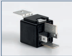
Artikel-Nr. 2652.10 Relais für 12 Volt