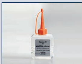
Artikel-Nr. 2680.01 Spezialöl für MARTIN-Hörner, Spritzkännchen mit 50 ccm Inhalt

Bei Bestellung bitte die Betriebsspannung angeben!