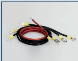
Artikel-Nr. 2651.21 Kabelsatz 24 Volt